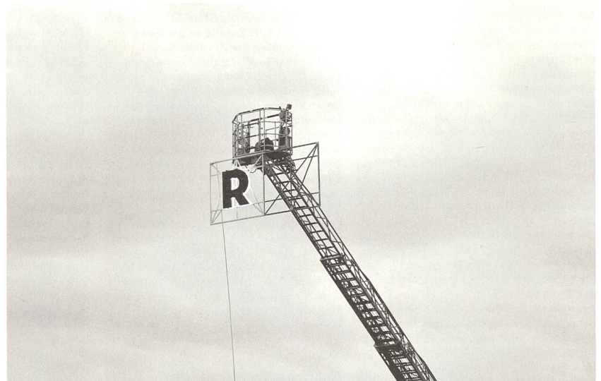
Museum für Gestaltung, Zürich: 3D-Schrift am Bau. Hauser Schwarz, Bemusterung für Aussenbeschriftung «Rakete», Basel, 2012.

Graz HDA Demolished – Modified – Endangered Modelling Austrian Architecture of the 20th Century bis 11.1.2019 www.hda-graz.at