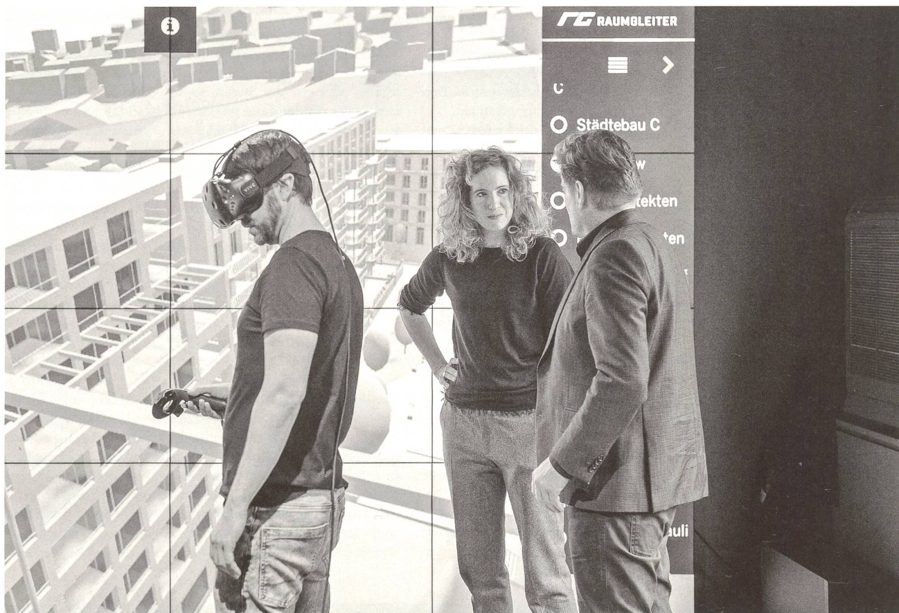
Die virtuelle 3D-Betrachtung behauptet eine fast «wissenschaftliche Vergleichbarkeit» der Projekte.