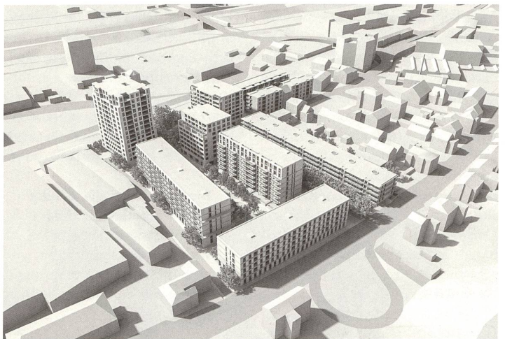
Zweite Phase «Design»: Öffnungen und Gliederungen spiegeln einen architektonischen Ausdruck vor, der aber nicht durch Konstruktion und Material belegt ist