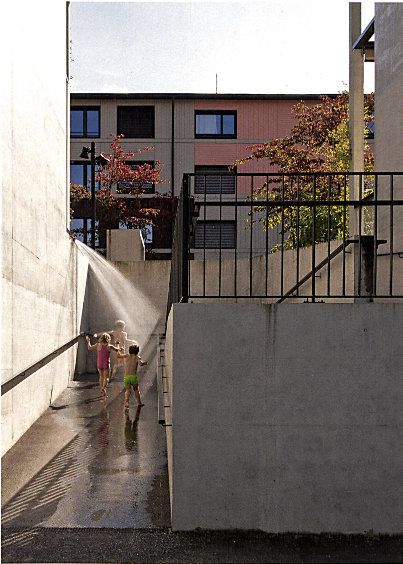
Nur selten haben Engstellen wie hier in der Siedlung Grünmatt von Graber Pulver Architekten (Zürich, 2014) auch ein performatives Potenzial.

Kaum ein anderes Thema hält uns derart im Bann wie das des Stadtraums. Dem schwer fassbaren Dazwischen widmeten wir in den letzten Jahren etliche Hefte, so etwa Commons (wbw 4–2012), Massstabsprünge (wbw 10–2012), Stadt auf Augenhöhe (wbw 6–2013), Strassenräume (wbw 10–2014), Dichte und Nähe (wbw 10–2015) und zuletzt Zwischenkritik (wbw 5–2016). Unsere Hartnäckigkeit hat einen naheliegenden Grund: Es gibt in dem Bereich noch viel zu tun.