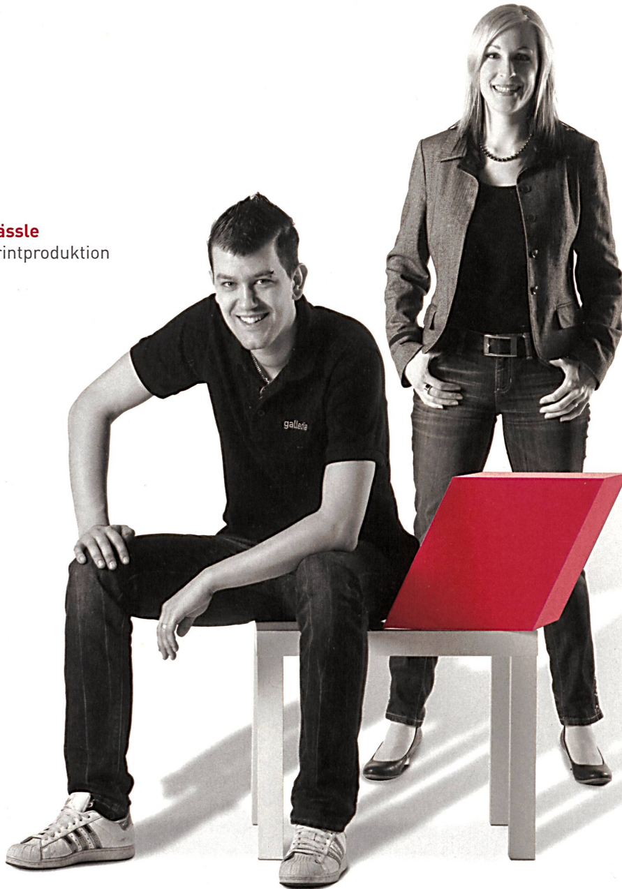
Corinne Sager Digital Solutions

Unsere 220 Mitarbeitenden überzeugen mit Spitzenleistungen. Sie garantieren einen exzellenten Service bei der Realisierung von Fachzeitschriften und Printprodukten sowie in der Umsetzung von Web- und Videoprojekten.