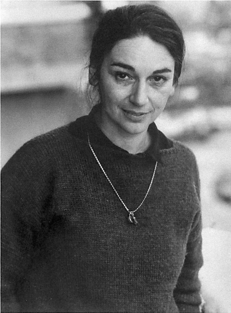
Flora Ruchat-Roncati, ca. 1985

Als eine zentrale Akteurin der Tessiner Tendenza hat sich Flora Ruchat-Roncati in die Geschichte der Schweizer Architektur eingeschrieben und mit bedeutenden Werken die Landschaft der Schweiz geprägt. In ihrer Ideenwelt verbindet sich die Schweizer Nachkriegsmoderne im Geist Le Corbusiers mit dem italienischen Rationalismus, in ihrer Biografie sind die Stationen Zürich und Rom ebenso wichtig wie das Tessin oder Friaul.