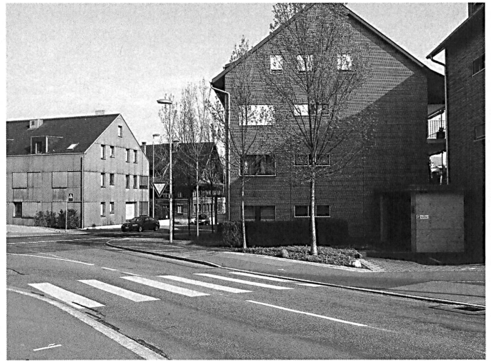
Die scheinbar problemlose, stilgerechte Einfügung bedroht «das echte Alte»: Historisierende Architektur der frühen Nachkriegszeit in der Altstadt von Zürich (links) – und äusserlich angepasste Neubauten im Ortskern von Baar (rechts).

Im Januar 2017 wurden an einer gut besuchten Tagung in Aarau die Auswirkungen des ISOS (Inventar schützenswerter Ortsbilder der Schweiz) auf die Innenverdichtung diskutiert. Im Raum stand die Frage: Geraten weite Teile unserer Orts- und Stadtbilder unter die sprichwörtliche Käseglocke? Fachleute von Bund und Schutzorganisationen beschwichtigten: Eine ISOS-Empfehlung sei zwar wichtig, bedeute aber noch keinen Schutz im denkmalpflegerischen Sinn; qualitätvolle Verdichtung sei weiterhin möglich, auch im Bereich geschützter Ortsbilder.