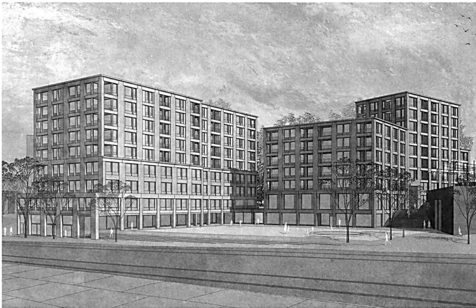
Unerwünschte Rue corridor: Das zweitplatzierte Projekt von Ballmoos & Krucker baut Stadt. Es unterscheidet klar zwischen öffentlichen Strassen- und privateren Hofräumen. Der Platz ist kleiner und liegt direkt an der Route de Ferney.