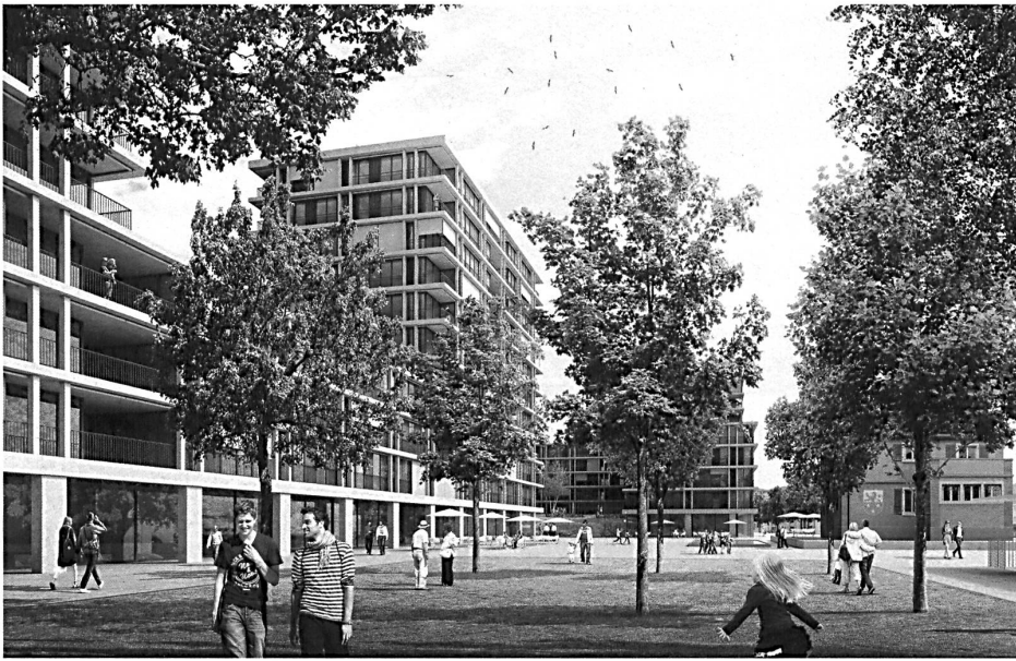
Rationalistische Eleganz: Das Siegerprojekt von Group 8 mit offenen Rasterfassaden und dem zurückgesetzten Platz an der dörflichen Route de Colovrex setzt auf die klassisch moderne Auffassung vom Wohnen.