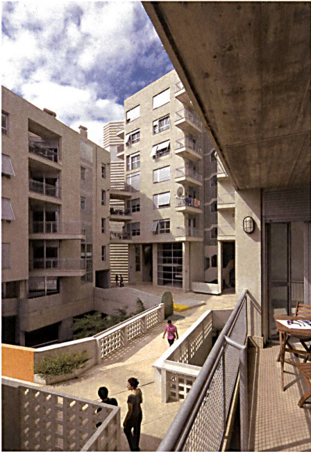
Gebaute Nachbarschaft: Das Edificio 111 von Flores & Prats in Barcelona. → S. 63