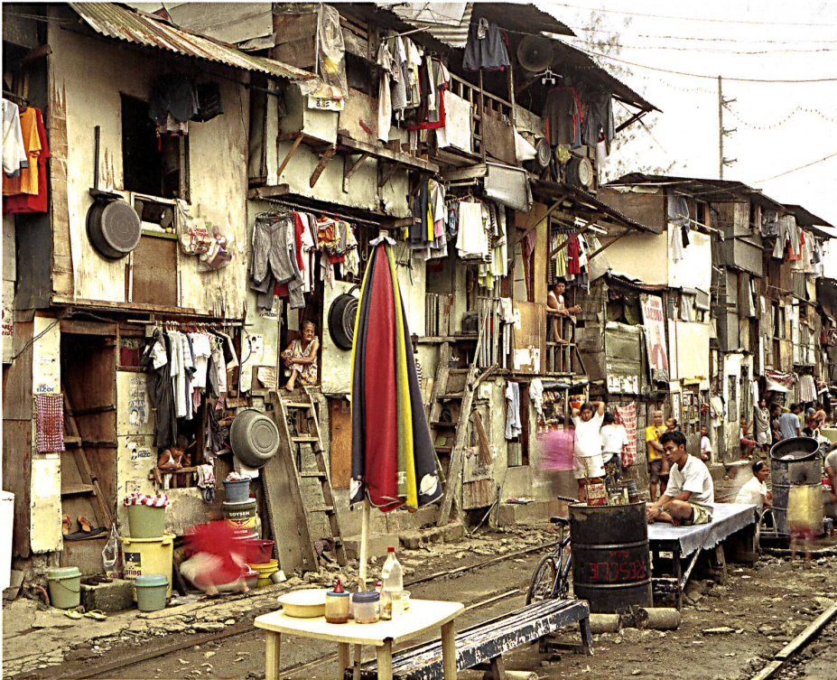
Genauer Blick auf die Widersprüche in der gebauten Welt: Wohnen am Bahngleis. → S. 30

Titelbild: Das Bild löst sich vom Raum, die Fotografie vom Gebauten. Wo aber bleibt Alltägliches wie Menschen oder Wetter?