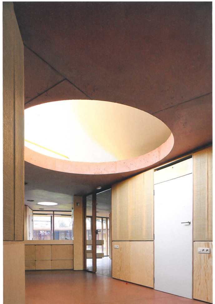
Oblichter erhellen die Tiefe der Servicezone im schmalen Gruppenraum.