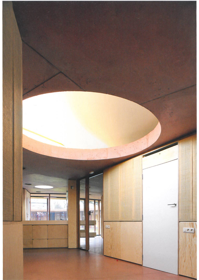
Oblichter erhellen die Tiefe der Servicezone im schmalen Gruppenraum.