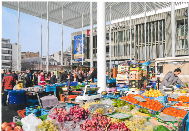
Das neue Vordach bringt das brutalistische Stadttheater aus den Siebzigern zum Verschwinden und schenkt den Bürgern ein Foyer für vielfältige Aktivitäten.