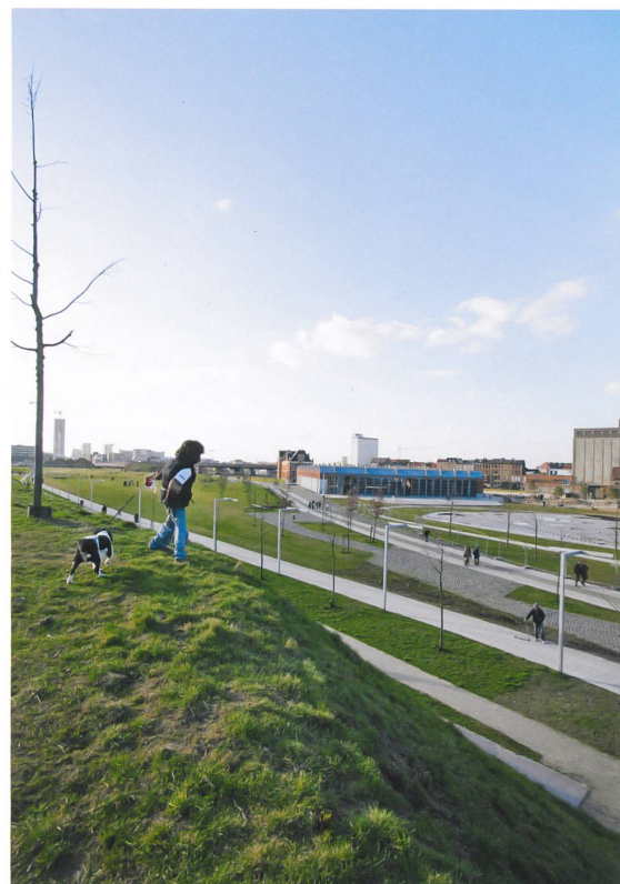
Der Park Spoor Nord ist kein Design-Event, sondern niedragschwellige Aneignungsfläche, für die migrantisch geprägte Anwohnerschaft ebenso wie für Weitgereiste.

Der Strukturplan zeigt es: Die Nord-Süd-Entwicklung entlang der Schelde löst das Paradigma der Radialentwicklung mit dem Speckgürtel rund um den Verkehrsring ab.