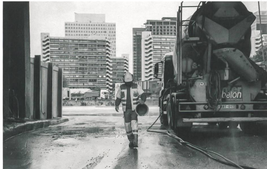
Bozar, Brüssel: A Good City Has Industry

Dessau Stiftung Bauhaus Dessau Grosse Pläne! Die Angewandte Moderne in Sachsen-Anhalt 1919–1933 bis 6.1.2017 www.bauhaus-dessau.de