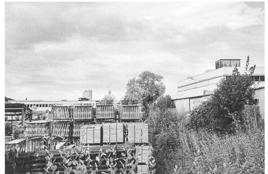
Fotomuseum Winterthur: Peter Piller aus Peripheriewanderung Winterthur , 2013/2014. C-Print, 30 x 40 cm

Salzburg Initiative Architektur Holz – Nachhaltiges Bauen in Finnland 18.2. bis 13.3. www.initiativearchitektur.at