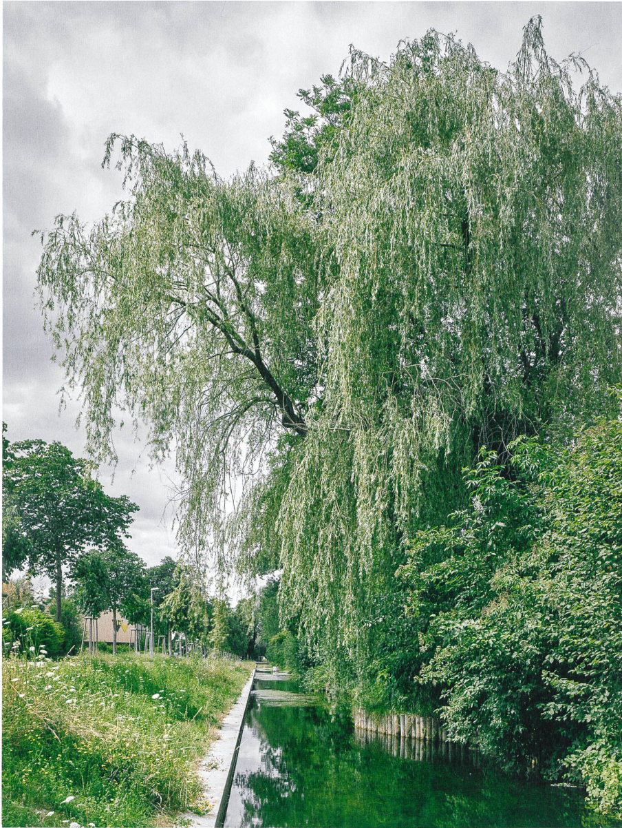
Der Wasserlauf des einst verlandeten Industriekanals wurde im Zuge der Arbeiten wieder hergestellt. Dafür wurden die Eigentümer in die Pflicht genommen.

ist der von Stauer & Hasler entworfene Pavillon: 64 × 12 Meter, mit einem verbindenden Dach über zwei Baukörpern, ruht er auf der Geländekante am Standort der alten Militärbaracken und ist Ausgangsbasis für Parkbenutzer und Grundinfrastruktur für kleinere Stadtfeste.