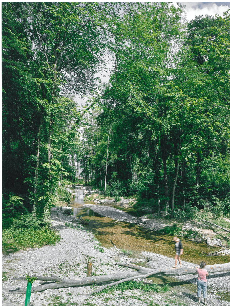
Naturraum und Abenteuerspielplatz: Der wiederbelebte Altlauf der Murg.