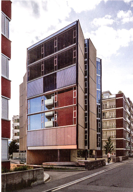
Der freie Stadtraum der brasilianischen Moderne: Das Wohnhaus Casa Pico in Lugano. → S. 76