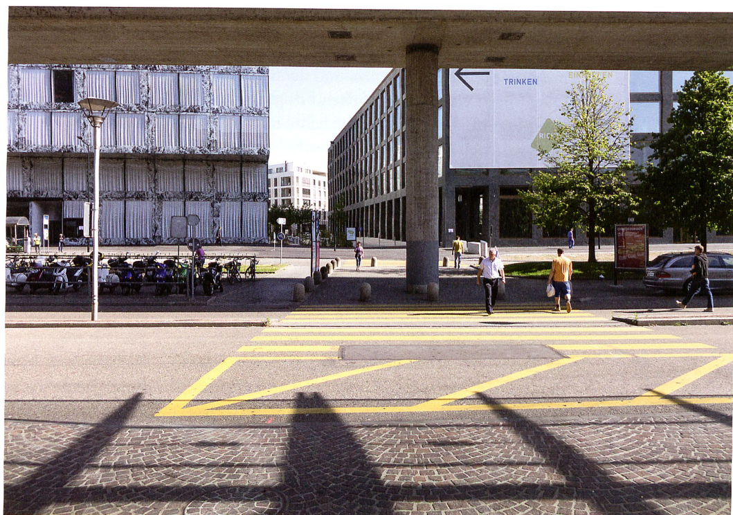
Der Eingang zum Richti-Areal vom Einkaufs- zentrum Glatt, links das Hochhaus von Wiel Arets und rechts der Bürobau von Max Dudler. Läden und Atmosphäre profitieren von der günstigen Passantenlage zwischen Bahnhof und Mall.