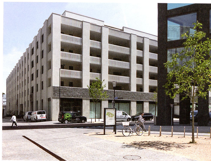
Blick von Süden in Richtung Hauptplatz. Links die Fassade des Hochhauses von Wiel Arets auf Baufeld 7, dahinter dessen Block auf Baufeld 1. Rechts das Büro- Geviert von Max Dudler auf Baufeld 6 (Bild links).