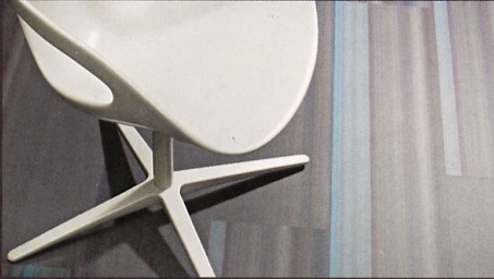
allura premium 0.7 commercial 0.55