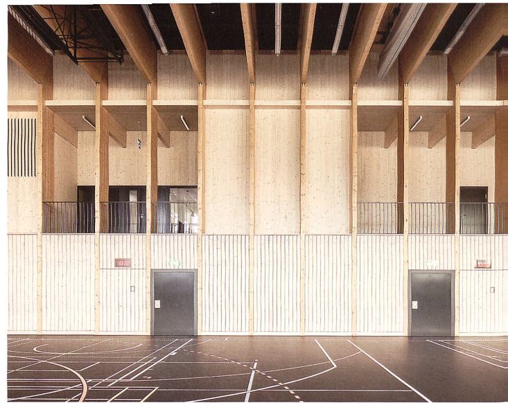
Die filigrane Tragstruktur mit parallelen Zweigelenrahmen gliedert die Innenräume

einander verschobene Segmente. Diese Differenzierung wird innerhalb der drei Fassadensegmente jeweils durch die Verbreiterung der Fugenabstände zwischen den Lamellen bei gleichzeitiger Verkleinerung der Lamellenbreite verstärkt. Grosse Öffnungen im Norden versorgen die vier Sporthallen mit konstantem Tageslicht. Gegen Süden gewährt ein Lamellenvorhang eine ausreichende Belichtung und sorgt gleichzeitig für einen guten Sicht- und Sonnenschutz der dahinter liegenden Innenräume. An den beiden Querseiten des Sportzentrums steigen die Metallbänder leicht diagonal an: durch das kompositorische Element der Diagonale wird eine geometrische Spannung in der Fassade erzeugt.