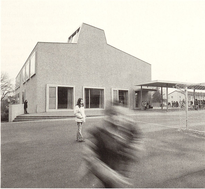
Das Schulhaus Mattenhof hat sich mit seinem rauhen Kellenwurfputz und der feinen Lichtführung im Inneren als wichtiges Gebäude in das Stadtbild von Zürich Schwamendingen eingeschrieben.