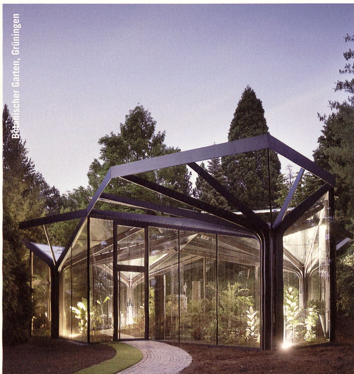
Parämsischer Garten, Grünigen

29.8. Zürich, Bund Schweizer Archi- tekten BSA, Ortsgruppe Zürich Autonome Architektur Aldo Rossi in Zürich, Begegnung mit Zeitzeugen Kontakt: p.wappel@agps.ch