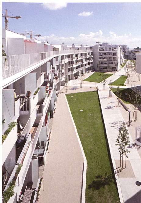
Die Wohninsel «Oase 22» in Wiens Nordosten. Anknüpfend an die grossen Wohnhöfe des Roten Wiens bauten drei Wohnbauträger rund 350 Wohnungen rund um einen mäandrierenden Hof. → Wohnen für Vorstadtinsulaner, Seite 36

Wolfgang Thaler (1969), fotografierte für uns in Transdanubien. Er lebt und arbeitet seit seiner Ausbildung an der Bayerischen Staatslehranstalt für Photographie in München als Fotograf in Wien. Von ihm stammen verschiedene Dokumentationen zu architekturgeschichtlichen Themen, zuletzt über die sozialistische Moderne in Ex-Jugoslawien, «Modernism In-Between» oder zur Entstehung des Quartiers am Südbahnhof in Wien.