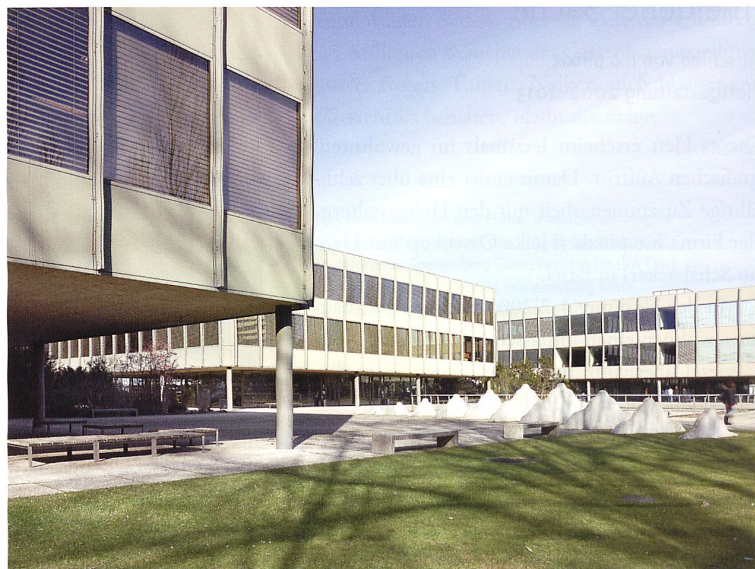
Das Gymnasium Strandboden in Biel in einer aktuellen Aufnahme