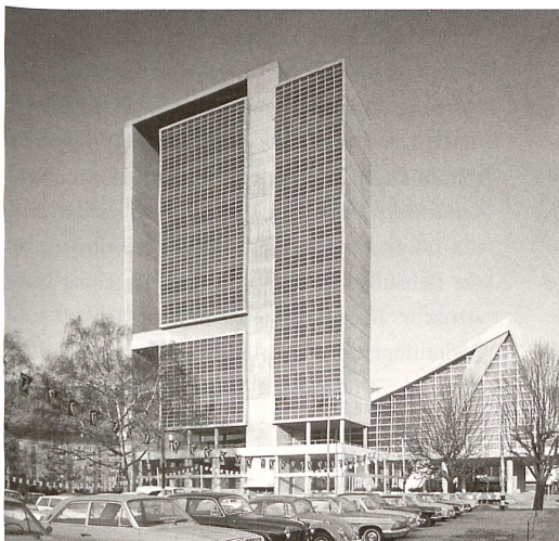
Kongresshaus Biel, Aufnahme aus den 1960er Jahren