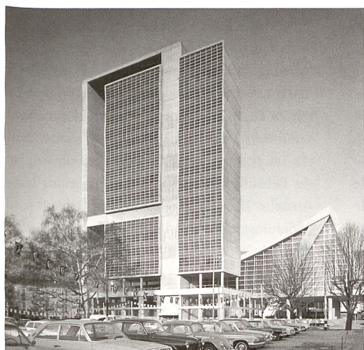
Kongresshaus Biel, Aufnahme aus den 1960er Jahren