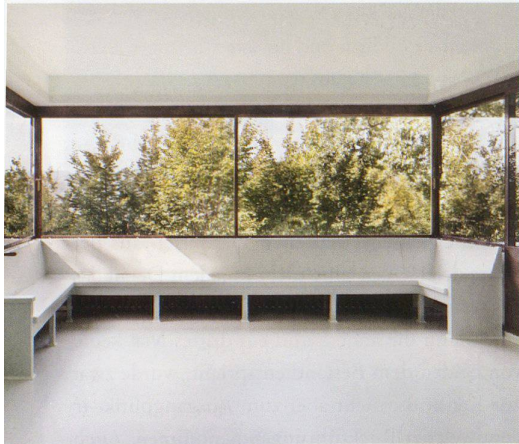
Die über Eck gezogenen Fenster, oft präzise auf Einbaumöbel abgestimmt, prägen die Aussicht nach Süden. Die Eingangsseite hingegen weist eine Lochfassade auf, die Nutzräume wie die geschwungene Treppe belichtet.