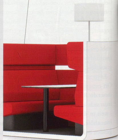
WORK LOUNGE FÜR LOCKERE BESPRECHUNGEN

LO Mindport von Lista Office LO ist das neue Raummöbelsystem, das offene Arbeitswelten strukturiert