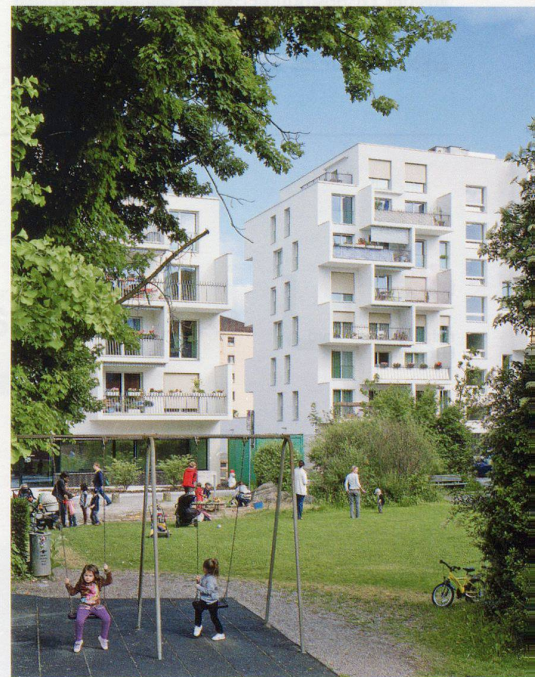
Drei gestaffelte Baukörper auf einem Gemeinschaftssockel (oben); Vorraum für vier Wohnungen (unten)

Mit der Entscheidung, die Wohnungen als Vierspänner in drei Volumen mit je eigenem Eingangsbereich anzuordnen, fanden die Architekten die Zustimmung der Wettbewerbsjury, die die