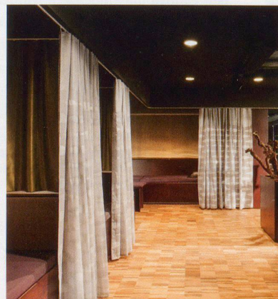
Tauchbad und Waschnischen