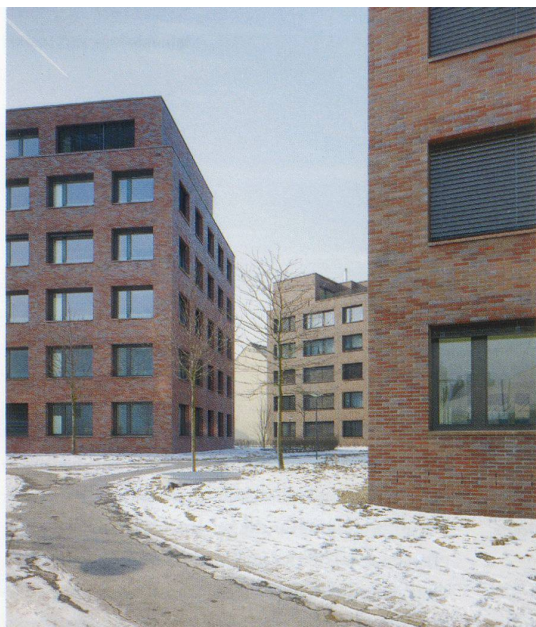
Offene Folge von Hofräumen