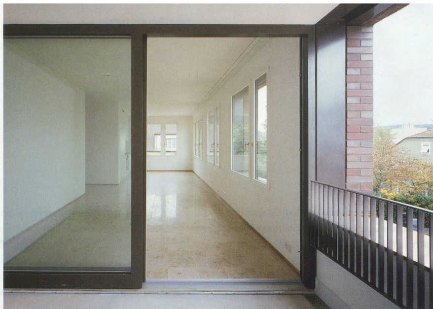
Lochfassaden für Wohnung und Loggia