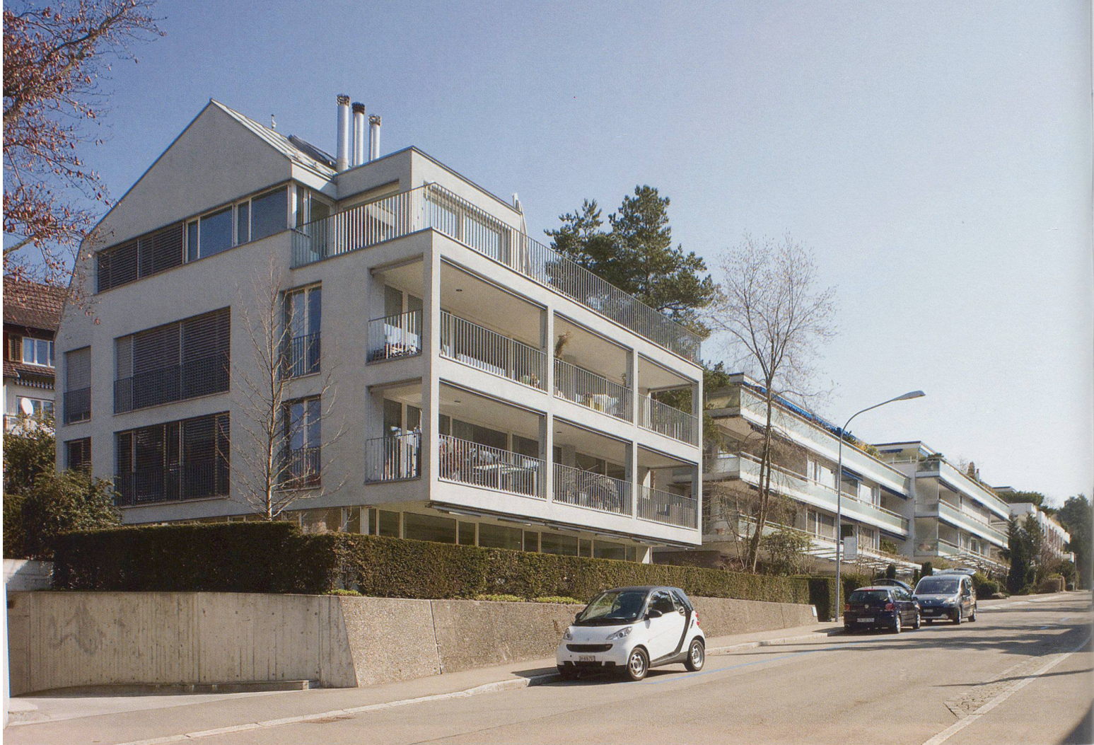
Zürich-Fluntern, Neuhausstrasse.