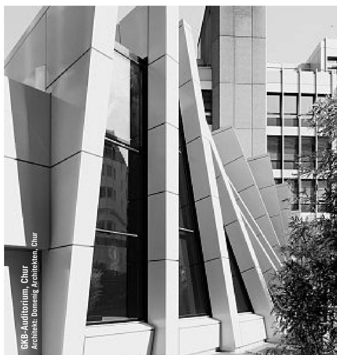
GKB-Auditorium, Chur Architekt: Domenig Architekten, Chur