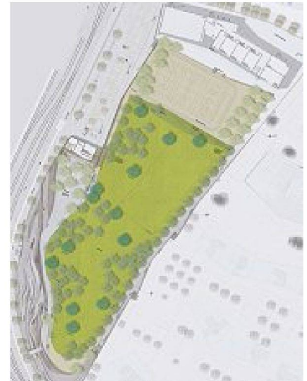
Siegerentwurf «WeidWest» vom jungen Zürcher Büro antón & ghiggi landschaftsarchitektur, Ideenwettbewerb Schule: Baumann Roserens Architekten