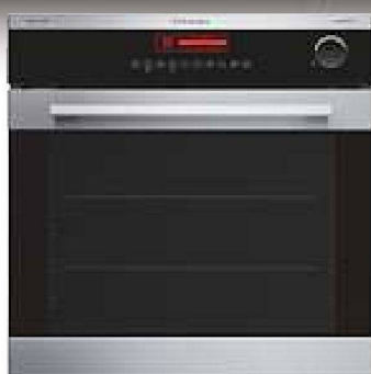
Der neue Kombibackofen Profi Steam. Entwickelt für Profis, adaptiert für Sie.

Genau wie die Geräte, die wir für die weltbesten Restaurants entwickelt haben, kombiniert der neue Kombibackofen Profi Steam die Dampfgar- und Heizfunktion, um den natürlichen Geschmack und die typische Konsistenz der Nahrungsmittel zu bewahren.