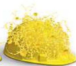
Nachhaltigkeit &amp; Innovation

Auf die Erstellung hochkomplexer Klinker- und Sichtsteinfassaden haben wir unser Fundament gebaut. Dass wir visionär denken und entsprechend planen und realisieren, beweisen wir täglich in sämtlichen Bereichen unserer Geschäftsfelder. Wir schaffen Mehrwert, mit System am Bau: www.keller-ziegeleien.ch