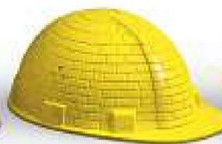
Mauerwerk &amp; Bauteile