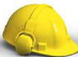
Innenausbau &amp; Akustik