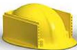
Fassaden &amp; Boden