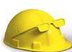
Planung &amp; Ausführung