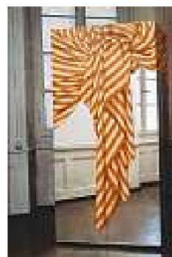
Lehrstück II (links) und Lehrstücke IV

Die Breite des Schaffens der Haussmanns umfasst auch viele Experimente, und das oben beschriebene Ernst Nehmen der Lust, einer Idee nachzugehen, ist wohl eine der wichtigen Triebfedern der unkonventionellen Projekte des Paares. So entwickelten sie Anfang der Achtzigerjahre einen Begriffsschieber, mit dessen Hilfe sich 100 Begriffe zu 10 000 Begriffspaaren kombinieren lassen und auf diese Weise der Experimentierlust auf die Sprünge geholfen werden kann. Dieses Jahr haben sich zwei Kunstgeschichtsstudenten dafür interessiert und eine Aufnahme mit zufälligen Begriffen in vier Sprachen gemacht. «Wir hatten Spass am freien Spiel mit Begriffen, Wörtern und Dingen. So hatten wir uns das bei den Dadaisten vorgestellt: Das Spiel mit dem Zufall war eine Inspirationsquelle, die nie versiegte, und nicht alles war gar so ernst und theoretisch wie manche unserer Vorbilder das sahen», erläutert Robert Haussmann.