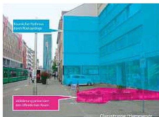
«Handbuch zur Gestaltung von innerstädtischen Freiräumen» von schneider studier primas GmbH und Studio UC

nungsbüro Maxwan aus Rotterdam und dem Ingenieur- und Planungsbüro Basler & Hofmann aus Zürich. Das Beurteilungsgremium, das grösstenteils mit lokalen VertreterInnen von Politik, Verwaltung, Fachwelt und Interessenverbänden besetzt war, würdigte damit ein Konzept, das in erster Linie durch einen Verzicht auf allzu konkrete Aussagen auffällt.