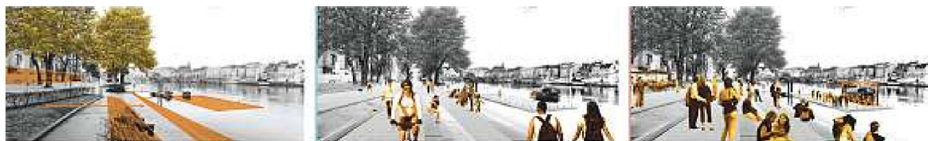
Vorschlag des Siegerprojekts: «Articulated City», «Flux» und «Relax» für die Rheinpromenade