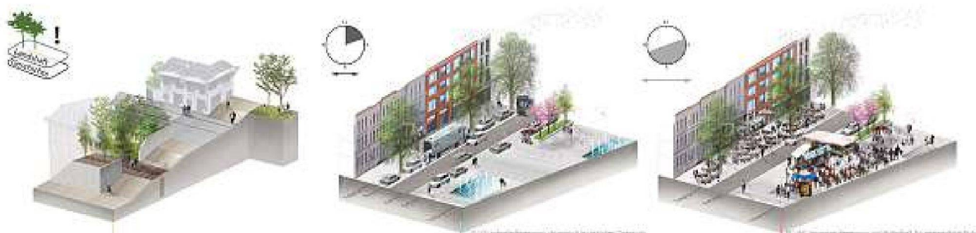
Stadtanalyse des Siegerprojekts: «Articulated City» und «Shared City» als «Flux» (Mitte) und «Relax» (rechts) als verschiedene Ausprägungen von Urbanität