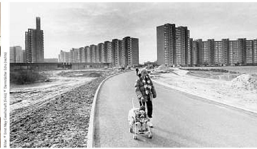
Siedlung Darmstadt-Kranichstein, 1965-1970

litische und kulturelle Klima im stalinistischen System hatte sich grundsätzlich gewandelt. An eine Rückkehr in das nun nationalsozialistische Deutschland war jedoch nicht zu denken, nachdem Josef Goebbels ihn öffentlich diffamiert hatte. Zu Gast beim Zürcher Architekten Karl Moser, äusserte sich May eindeutig; er «hält das jetzige Regime für brutal, rücksichtslos, kulturlos reaktionär.» Er entschied sich für das afrikanische Exil und ging mit seiner Familie zunächst nach Tansania, 1942 ins benachbarte Kenia, wo er als Architekt tätig war und bei einigen Aufgaben seiner