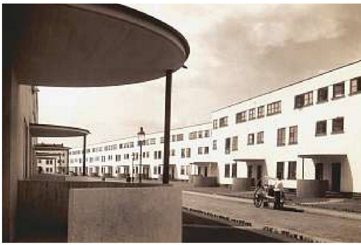
Siedlung Bruchfeldstrasse in Frankfurt, 1927