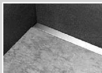
System wedi Rioluta