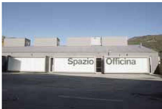
Architektur im Film-Bild: Steg am Zürcher Obersee von Reto Zindel und Kulturinsel in Chiasso von Durisch Noll

leiter, Designstudenten und Kinotheaterbetreiber. Vermittelt wird die Architektur in erster Linie durch das Reden über die Bauten. Die Vergangenheit aufleben lässt die Geschichte des kunsthistorisch wertvollen Kinos aus den dreissiger Jahren, die Gegenwart bringen Impressionen aus vollen Konzertsälen näher.