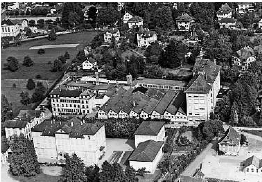
Geschütztes historisches Theiler-Areal

Ohne eine übergeordnete ortsbauliche Geometrie einzuführen, entstehen räumliche Beziehungen und Begegnungsmöglichkeiten, die dem Schulalltag der Wirtschafts- und Fachmittelschule die gewünschte Dichte an Austausch bringen. Die Form und die Organisation des Schulneubaus sind der Entwurfsidee und der Suche nach Massstäblichkeit untergeordnet, die eigentlichen Schulzimmer erst ab dem ersten Obergeschoss untergebracht. Hier gibt es eine zweite Pausenhalle mit