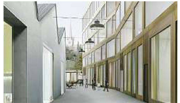
Siegerprojekt von Darlington Meier Architekten, Zürich

direktem Zugang zum hangseitigen Obstgarten. Mit den Spezialräumen im obersten Geschoss setzen die Architekten dem Schulneubau architektonisch eine Krone auf.