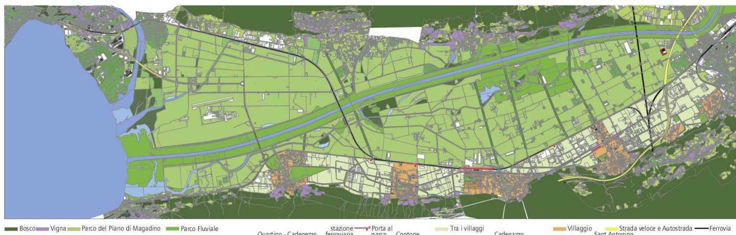
«La Strada del Piano», Projekt für eine Schnellstrassenverbindung A2-A13, Bellinzona-Locarno.

gisch neu zu bewerten. Die Magadinoebene ist ein Naturraum, der im Norden und im Süden von Bergen begrenzt wird. Durch die Ebene zieht sich von Osten nach Westen der kanalisierte Fluss Ticino. Die Eisenbahnlinie bildet im Norden die Grenze des Naturparks «Parco del Piano del Magadino», dessen natürliche und landwirtschaftliche Eigenheiten als Erholungsraum geschätzt und bewahrt werden. Ebenso wichtig ist der Flussraum, der sich als «Parco Fluviale» vom See bis mindestens nach Biasca erstrecken sollte. Klar begrenzt das Trasse der Eisenbahn weiter eine südlich, am Fusse der Berge gelegene, weite Fläche, die sich von Osten nach Westen erstreckt. In diesem Teil