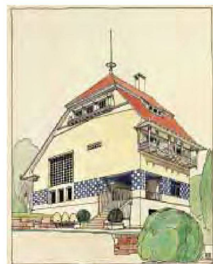
Haus Olbrich auf der Darmstädter Mathildenhöhe, 1900