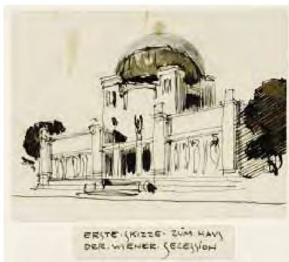
Ausstellungsgebäude der Wiener Secession, Skizze zum endgültigen Entwurf, 1897