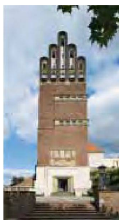
Hochzeitsturm auf der Mathildenhöhe Darmstadt, 1908, Fotografie 2009