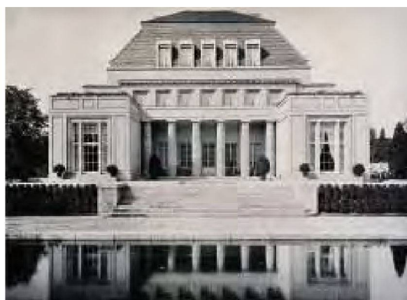
Gartenansicht der Villa Feinhals in Köln-Marienburg, 1908