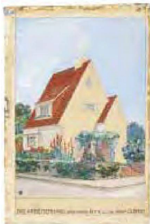
Arbeiterhaus der Firma Opel für die Hessische Landesausstellung auf der Mathildenhöhe, 1908

Alle diese Stationen im produktiven, schier rastlosen Arbeitsleben Olbrichs sind in der 1000 m 2 umfassenden Ausstellung am authentischen Ort sowie im Katalog jeweils mit herausragenden