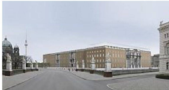
Sonderpreis: Kuehn Malvezzi, Berlin. Rechtes Bild: Humboldt-Forum

Die an der zweiten Runde des Wettbewerbs beteiligten Arbeiten werden bis zum 29. 3. 2009 in der Architekturgalerie am Weissenhof in Stuttgart gezeigt.