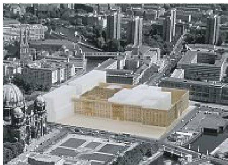
Entwurf Philipp Oswald