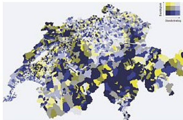
Bautätigkeit und Standortrating: Attraktivere Standorte weisen in der Regel eine höhere Bautätigkeit auf und werden damit dem Aspekt einer nachhaltigen Lage gerecht. – Quellen: Neubautätigkeit Wohnungsbau und Wohnungsbestand, BFS 2008; Standort- und Markt-rating Mietwohnungen, Wüest & Partner, 2009