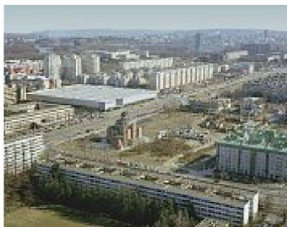
Formelle und informelle Bauten in Belgrad