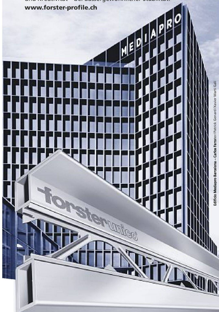
Edificio Mediapro Barcelona – Carlos Ferrater/Patrick Genard/Xavier Martí Galí

Im neuen Mediapro-Gebäude der spanischen Architekten Carlos Ferrater, Patrick Genard und Xavier Martí Galí steckt nicht nur ein geniales Auge für den perfekten Winkel. Sondern auch das weltweit erste, zu 100% aus Stahl gefertigte Profilsystem für wärmedämmte Fenster, Türen und Abschlüsse: Forster unico . Seine einzigartig schlanken Profilschnitte erlauben eine völlig neue Form von Ästhetik und Kreativität – bei aussergewöhnlicher Stabilität. www.forster-profile.ch