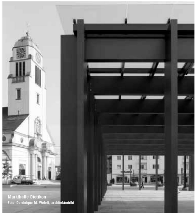
Markthalle Dietikon

Partner für anspruchsvolle Projekte in Stahl und Glas