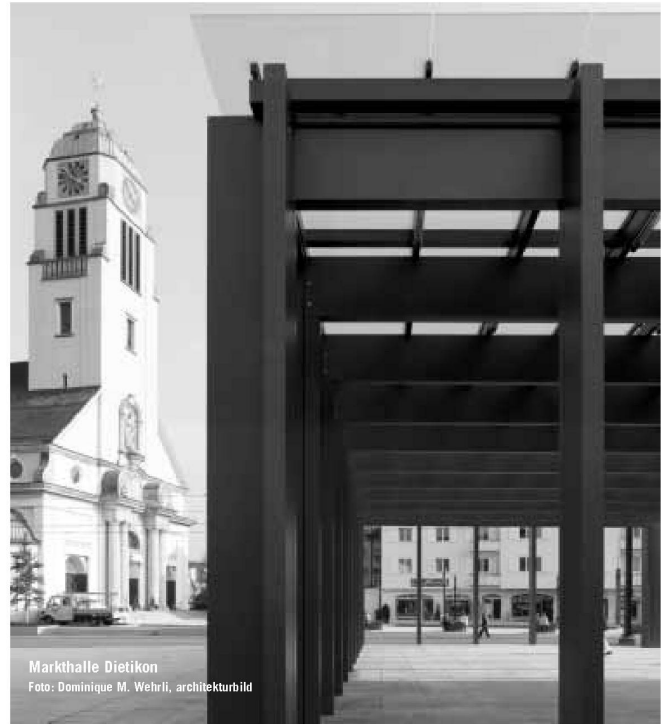
Markthalle Dietikon

Partner für anspruchsvolle Projekte in Stahl und Glas