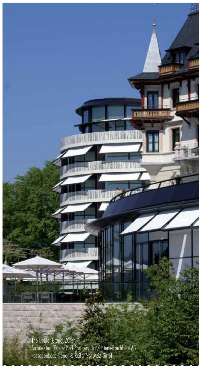
The Dolder Grand, Zürich Architekten: Foster and Partners Ltd./ Itten+Brechbühl AG Fassadenbau: Frener & Reifer Schweiz GmbH

Zürich, Museum Bellerive Eidgenössische Förderpreise für Design 2008 bis 1.2. www.museum-gestaltung.ch