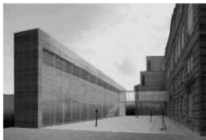
Wettbewerb Erweiterung Kunstmuseum Bern, 2007. Links: Siegerprojekt von Bachelard Wagner; rechts: 2. Preis von Baserga Mozzetti

zu eruieren, ist unsinnig und verweist lediglich auf die Tatsache, dass ein Wettbewerb durchgeführt wird, bevor sich die Bauherrschaft über ihre eigenen Zielsetzungen Rechenschaft abgelegt hat. Ein Wettbewerb für den Neubau einer Schule benötigt keine «richtungsweisenden» Zwischenbesprechungen, vorausgesetzt, es besteht ein verbindliches Wettbewerbsprogramm.