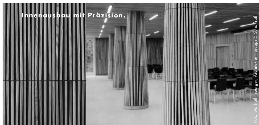
Innenausbau mit Präzision.

Die derzeit zu beobachtende Tendenz, dass die gewählten Verfahrensarten den gestellten Aufgaben bezüglich Komplexität oder öffentlichem Interesse nicht entsprechen, ist besorgniserregend. Die in der Vergangenheit mehrfach geforderte Durchführung von einstufigen, offenen Verfahren ist in den meisten Fällen nach wie vor gültig. Der Vorstand der BSA-Ortsgruppe Zürich hat dies kürzlich in einem offenen Brief, der sich kritisch zum laufenden Wettbewerbsverfahren der Kunsthäuserweiterung in Zürich äussert, sehr treffend formuliert (vgl. www.wbw.ch ): je öffentlicher eine Aufgabe, desto offener sollte das Verfahren sein! Komplexe, mehrstufige Verfahren können bei Aufgaben mit mehreren Bauträgern mit unterschiedlichen Interessen durchaus sinnvoll sein, da erforderliche Prozesse beschleunigt werden können. Ein Projekt für ein einfaches Verwaltungsgebäude in einem mehrstufigen Workshopverfahren