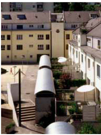
Scheuner Mäder Schild, Wohnbauten Hügelweg in Luzern, Eisenbahner-Baugenossenschaft Luzern 1990–91.