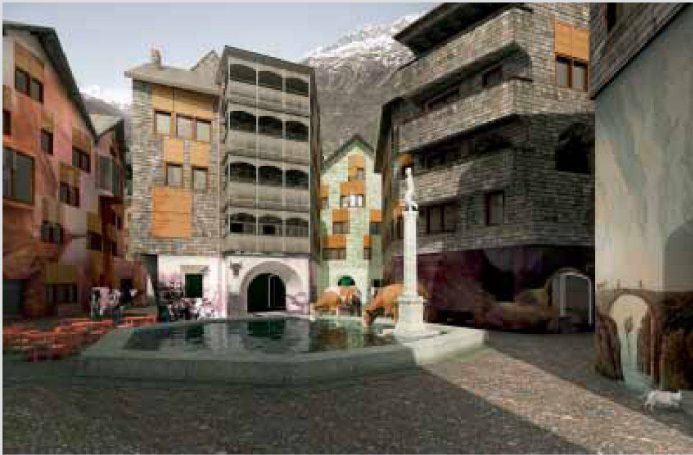
Bild unten links und rechts: Die Stadt Luzern im Jahr 2022, Zukunftsbilder der Tourismusstadt von Bosshard & Luchsinger Architekten, 2007

Bild oben rechts: Geplante gebündelte Linienführung von Neat (Bahn) und A4 im Felderboden zwischen Schwyz und Brunnen.