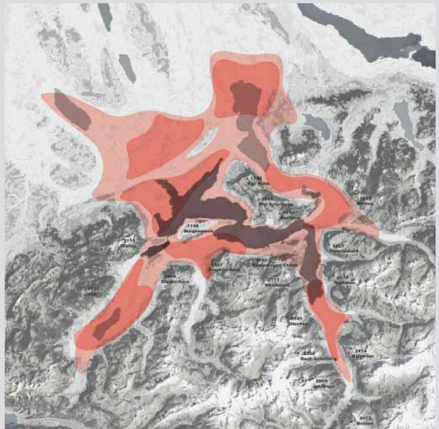
Städtenez der Zentralschweiz.