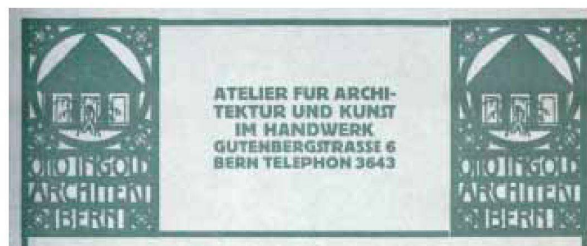
Der Briefkopf des Architekten Otto Ingold, 1913.