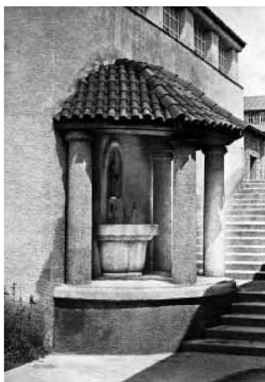
Links: Brunnen mit Figur von Etienne Perincioli. Unten: Portal von Georges Aubert. Ganz unten: Innenraum.

summary Only a few years after it was founded, the Federation of Swiss Architects (FSA) made an appearance at the National Exhibition in Bern in 1914 with its own pavilion. While, due in part to the outbreak of war the success of the exhibition was somewhat limited, and as the exhibition as a whole was not an architectural highpoint, the FSA recorded a great success with its pavilion. ■