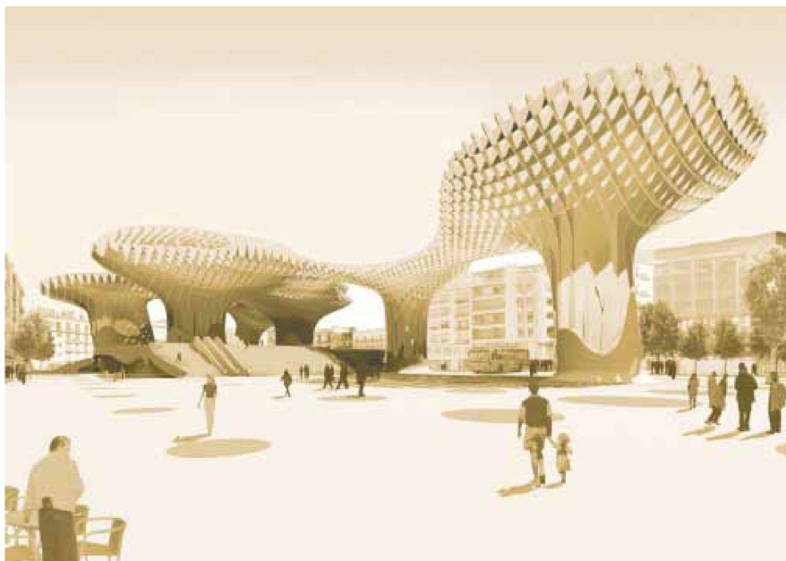
J. Mayer H. Architekten, Metropol Parasol, Neuordnung der Plaza de la Encarnacion in Sevilla; geplante Fertigstellung 2010

nen und Architekten als Entwerfende, als Unternehmer und als Akteure im urbanen Raum. Watzlawicks berühmtes Theorem «man kann nicht nicht kommunizieren», scheint für die Architektenschaft und ihre Auftraggeber auch ausserhalb der auf Branding-Architektur spezialisierten Mode-, Auto-, Kunst- und Freizeitbranche zur unentrinnbaren Tatsache geworden zu sein. Dem Publikum boten sich im KKL verschiedene Beiträge an, um aus eigener Sicht darüber zu reflektieren: Bernhard Franken entwirft Markenarchitektur für BMW. Seine Entwürfe als «intelligenter Markenarchitekt» (Zitat BMW) bestimmen die drei Markenwerte «dynamisch», «kultiviert» und «herausfordernd» sowie die engen baulichen Spielregeln für die Umsetzung der Marketingkommunikation in Verkaufsräumen und an Messen. Mehr Freiheiten hatte Coop Himmel(b)au, in der BMW-Typologie als «flexibler Star» bezeichnet, beim Bau der neuen BMW-Welt in München: Die Individualität des architektonischen Ausdrucks durfte hier einen Beitrag zur Marken(weiter)entwicklung leisten. Die schweizerische Premiere des chinesischen Architekturbüros MADA s.p.a.m. (Sunny Zhanhui Chen) enttäuschte, obwohl die Abkürzung s.p.a.m. für ein umfassendes Arbeitsfeld in Strategie, Planung, Architektur und Medien steht und gerade deshalb einen wichtigen Beitrag verspricht.